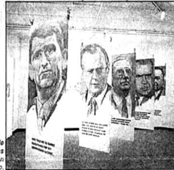
Retratos de Dos Caras por Jean Pinataro.